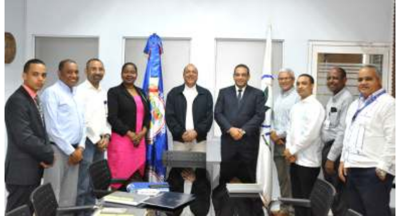
Convenio entre el IPL y la Asociación de Fabricantes, Representantes e Importadores de Productos para la Protección de Cultivos Inc. (AFIPA), firmado el pasado 12 de enero del 2018.

De la Asistencia Técnica, AFIPA proporcionará la orientación técnica y capacitación que se requiera dentro del marco del presente Convenio, a los estudiantes y profesores de IPL de las carreras Bachiller Técnico en Producción Agrícola e Ingeniería Agro-Empresarial. En las capacitaciones se entregará a cada participante un certificado de participación cuando estos hayan cumplido los objetivos y requisitos establecidos.